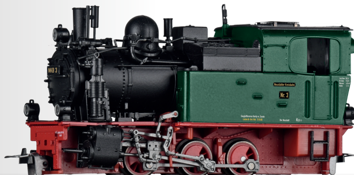
Dampflokomotive Nr. 3 der NKB Steam locomotive No. 3 of the NKB