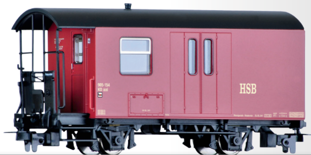
Packwagen KDaai der HSB Baggage car KDaai of the HSB